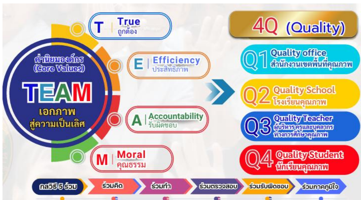
ภาพที่ 3 รูปแบบการพัฒนา TEAM 5 ร่วม to 4Q Model