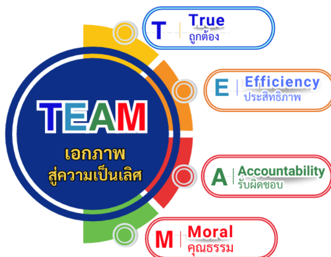
ภาพที่ 2 วัฒนธรรมองค์กร TEAM เอกภาพสู่ความเป็นเลิศ

ค่านิยมองค์กร “TEAM เอกภาพสู่ความเป็นเลิศ”