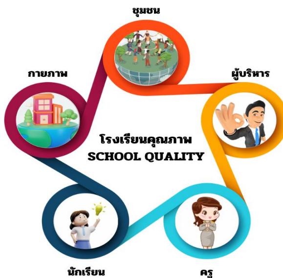
ภาพที่ 5 โรงเรียนคุณภาพ