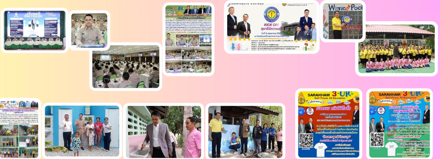
คลิปสั้น "สุขาดี มีความสุข SARAOKHAM 3OK" #สุขาดี มีความสุข SARAOKHAM3OK #สุขาดี มีความสุข