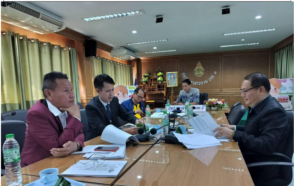
นำผลการวิเคราะห์ของผู้มีส่วนร่วม วางแผนปรับปรุงพัฒนาการดำเนินงานของสถานศึกษาในสังกัด