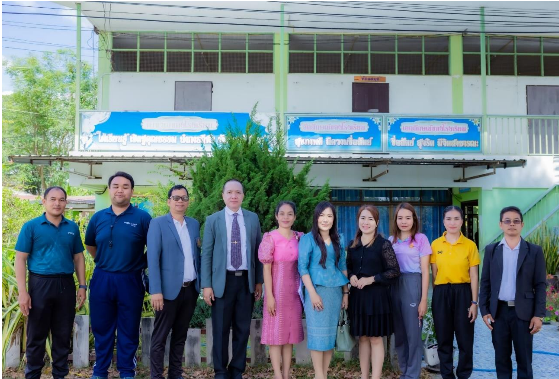
คณะกรรมการ กตปน.ร่วมนิเทศ กำกับติดตามการจัดการเรียนการสอนในโรงเรียน