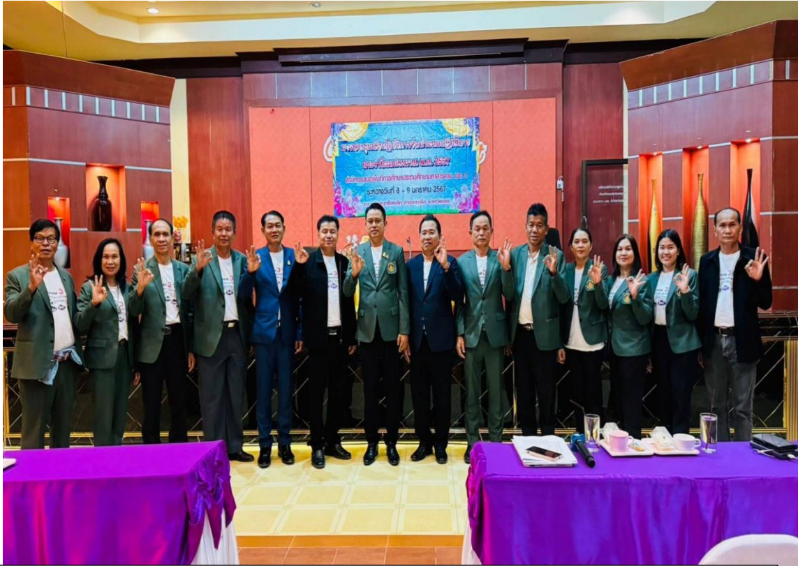
คณะกรรมการ กตปน. อ.ก.ค.ศ. ร่วมจัดทำแผนปฏิบัติการร่วมกับ สพป.มค. ๓