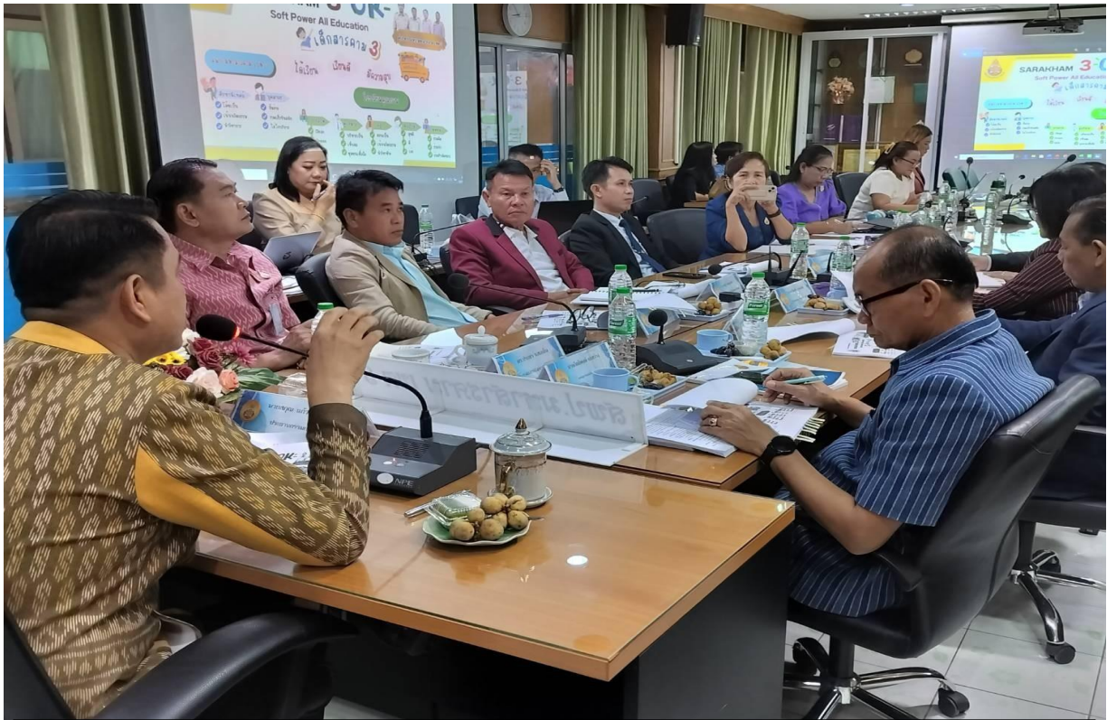
เปิดโอกาสให้บุคคลภายนอกมีส่วนร่วมในการดำเนินงานตามภารกิจ