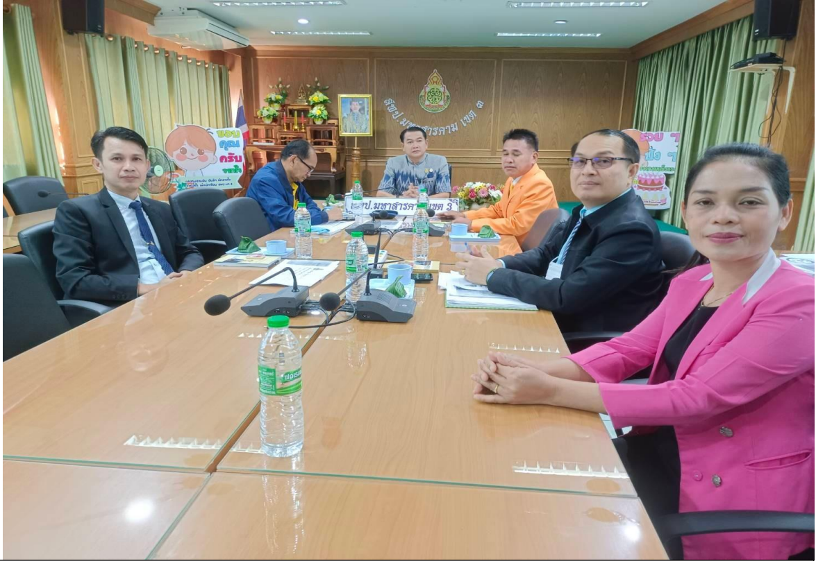
นำผลการวิเคราะห์ของผู้มีส่วนร่วม ร่วมวางแผนปรับปรุงพัฒนาการดำเนินงานของสถานศึกษาใน