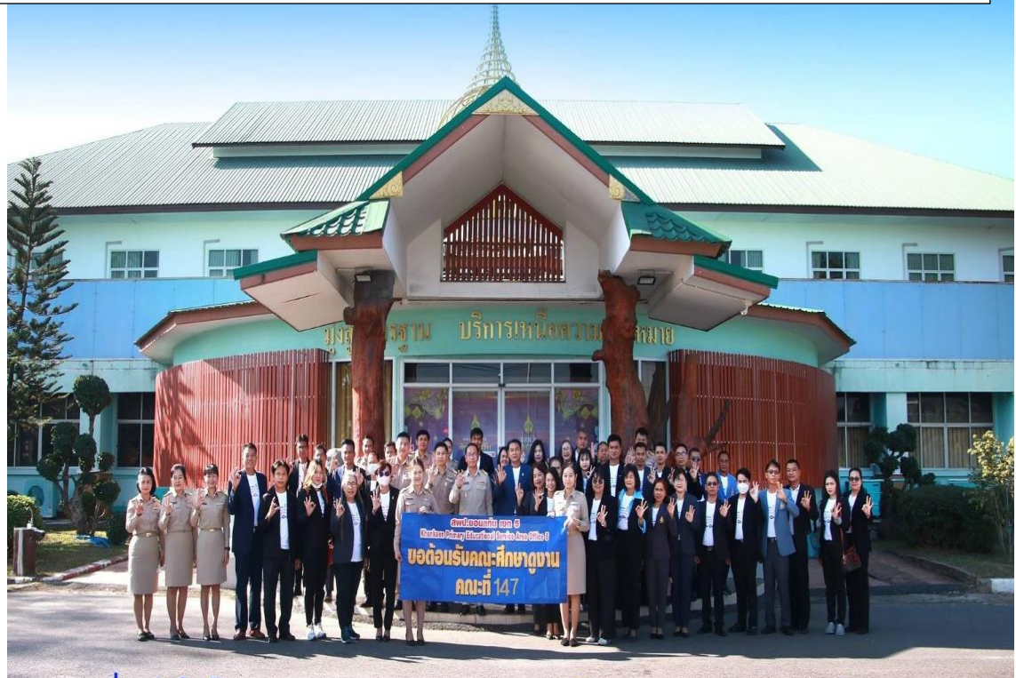
คณะกรรมการ กตปน. อ.ก.ค.ศ. ร่วม สพป.มค. ๓ ศึกษาดูงาน เพื่อนำผลที่ได้มาพัฒนาองค์กร