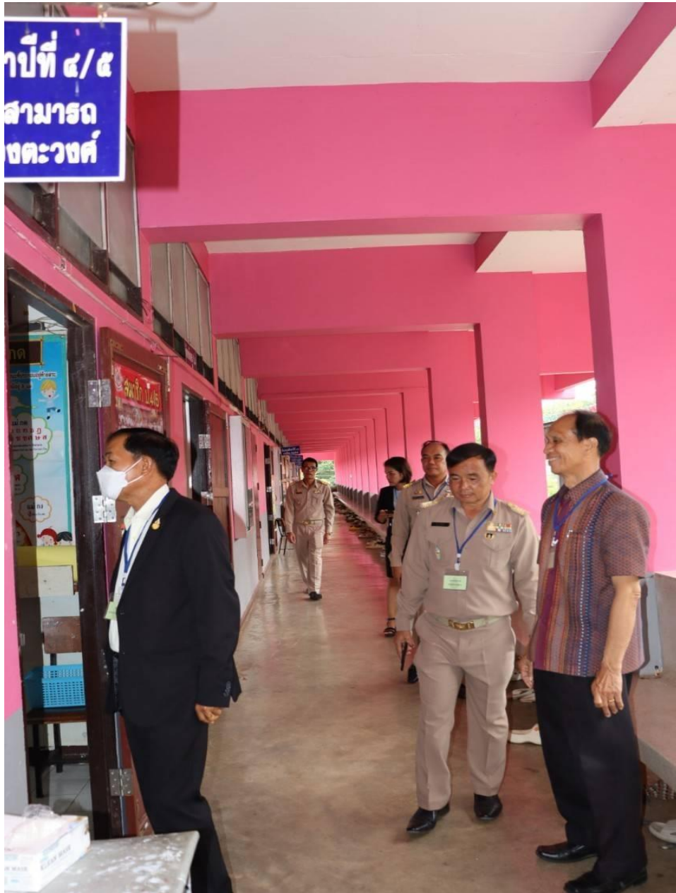
คณะกรรมการ กตปน.ร่วมนิเทศ กำกับติดตามการทดสอบ O-net