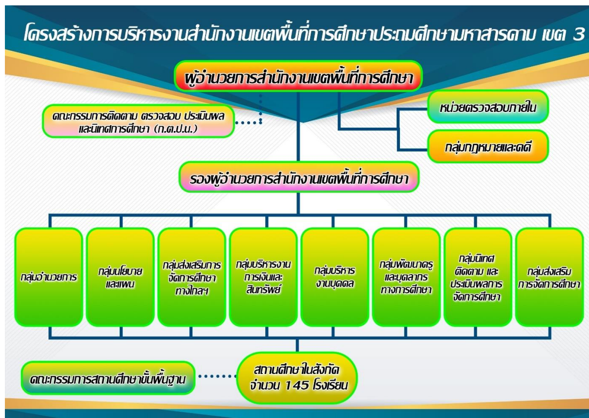
แผนภาพที่ 1 การแบ่งส่วนราชการภายในสำนักงานเขตพื้นที่การศึกษาประถมศึกษามหาสารคาม เขต 3