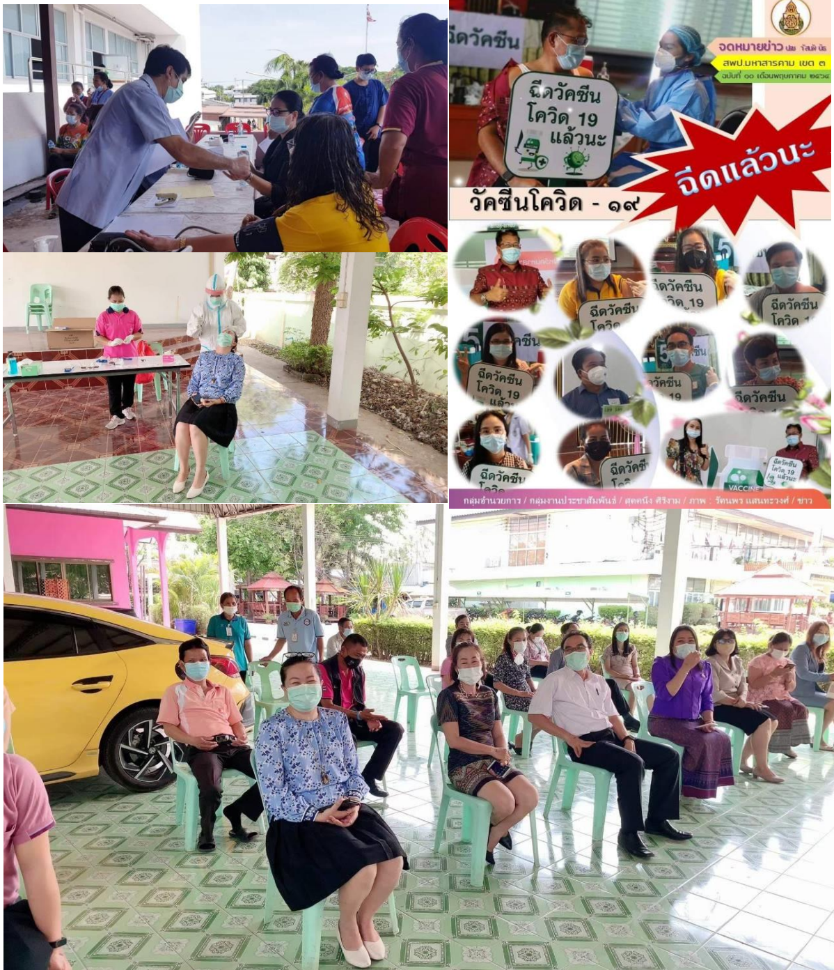
รูปภาพ : การฉีดวัคซีน และตรวจ ATK

บุคลากรทุกคนในสังกัดเข้ารับการฉีดวัคซีน และตรวจ ATK ทุกครั้งเมื่อมีความเสี่ยง การพัฒนาศักยภาพการปฏิบัติงานลูกจ้างประจำและลูกจ้างชั่วคราวในสำนักงานเขตพื้นที่การศึกษา ประถมศึกษามหาสารคาม เขต ๓ ปีงบประมาณ ๒๕๖๔