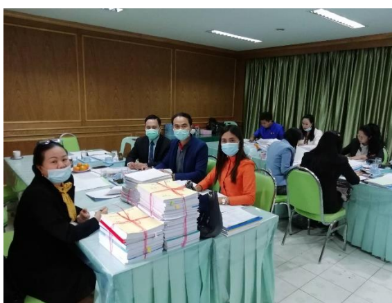
รูปภาพ : คณะกรรมการตรวจสอบคุณสมบัติ และจัดทำคะแนนการย้ายครูฯ ปีการศึกษา ๒๕๖๓

๒.๔ การลาออกของข้าราชการครูและบุคลากรทางการศึกษา ปีงบประมาณ ๒๕๖๓ จำนวน ๙ ราย