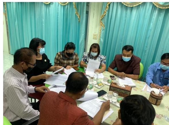
รูปภาพ: คณะกรรมการบริหารอัตรากำลัง สพ.ม.มหาสารคาม เขต ๓ ของ สพฐ.